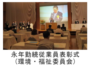
永年勤続従業員表彰式 (環境・福祉委員会)

5委員会・5部会を組織し、業界発展のための提言や研修会、会員間の異業種交流などの事業を行います。