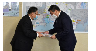
三遠南信自動車道 早期開通に向けた要望活動

会員から出た意見をとりまとめ、国・県・市などへ意見具申、要望、政策提言などを行います。