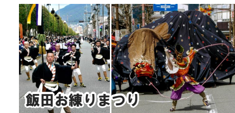
飯田お練りまつり

7年に一度開催される「飯田お練りまつり」や、飯田市と都市部を結ぶ「リニア中央新幹線」、名勝天竜峡を跨ぐ「天竜峡大橋」など、地域活性化に向けて様々な事業に取り組んでいます。