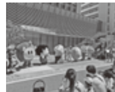
ゆるキャラのダンス