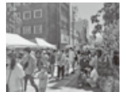
イベントを楽しむ人々