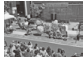
ゆるキャラが大集合

4月28日（日）にりんご並木周辺で、「ぽおの日曜日2024」が開催されました。いいだ人形劇フェスタの公式マスコットキャラクター「ぽお」をはじめ「地域戦隊カッセイカマン」や、今回初参加となる「ふだん着物乙女 みやえり」など、14体のゆるキャラが集まり、飯田信用金庫本店前広場のステージでダンスやショーを披露しました。ステージ前の観覧席は座りきれないほど賑わい、小さな子供達の歓声によって大いに盛り上がりました。りんご並木側では、春の陽気に誘われた多くの来場者が飲食や物販ブースで買い物を楽しみ、丘のまち一帯が笑顔に包まれた1日となりました。