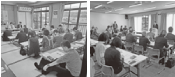
支部総会始まる(左 座光寺支部 右 松尾支部)

支部の定期総会が4月25日（木）の座光寺・竜丘・松尾の3支部を皮切りに、4月26日（金）には三穂支部で開催され、事業・決算報告、事業計画・予算案に加えて、今期は役員改選の年にあたるため、各支部新役員が承認され、新たな体制での活動がスタートしました。総会終了後には懇親会も開催され、会員同士等の交流の場となりました。今年度も各支部での活発な動きが期待されます。