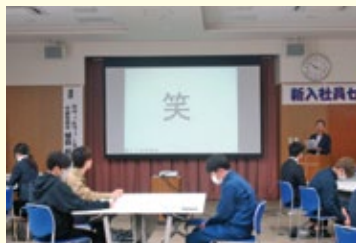
講師を1文字で例えると「笑」

参加者からは「働く姿勢、社会人になるということを学べた。」「電話対応、お茶を出す方法を具体的に教えてもらえて今後のためになった。」といった感想がありました。