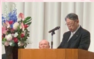
祝辞を述べる原会長

参加者からは「Uターンで戻ってきたので、知った人がいないと不安に思っていたが、何人もの同級生が地元企業に就職したことが分かり、再会できてうれしかった。」との声も聞かれました。