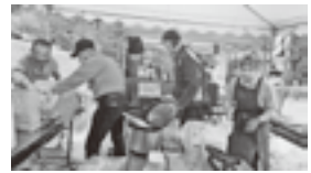
開店準備をする支部役員

野底山森林公園さくら祭りが4月21日（日）に開催され、上郷支部でも売店を出店し、お祭りへ協力をしました。当日は天気も心配されましたが、イベント開催中は雨も降らず、多くの方が来場しました。支部の売店も大盛況で、準備した団子と飲み物は、ほぼ完売しました。飲食以外にもパフォーマンスや各種体験コーナー等もあり、賑やかに開催されました。