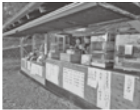
様々なものを販売した売店

例年、舞台桜をはじめ、麻績の里の桜の開花にあわせて行っている座光寺支部の売店が、今年も3月30日（土）～4月13日（土）の15日間開店しました。日替わりで支部役員・会員が担当して飲食料品等を販売しました。また、今年もさくら祭り際にはキッチンカーの出店もあり、多くの方が桜見物に併せて訪れました。