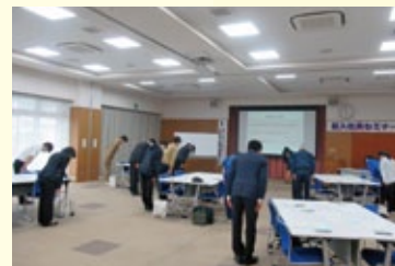
実践を通して学びました