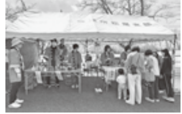
売店に訪れた家族づれ

松尾支部では、3月31日（日）に松尾城址公園で桜まつりを開催しました。昨年の桜まつりは桜が散ってから開催であったため、今年は1週間日程を早めて開催しました。残念ながら桜は咲かず、蕾の下での開催となりましたが、春の暖かな陽気に誘われ多くの方が公園に訪れていました。当日は支部で出店した射的を家族で楽しんだり、買ったばかりのお団子を芝生の上で食べたりと、思い思いの休日を楽しんでいました。