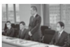
挨拶する根橋会長

原会頭からは地方企業の多くに労働組合がないため、2,700余の会員を有する商工会議所と連合との懇談会は大