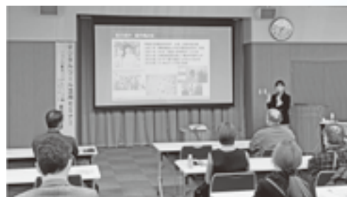
令和5年 デジタルツール活用セミナー

いいだ経営塾、原価管理セミナー、品質管理セミナー、 表計算ソフト活用セミナー、RPA活用セミナー、 IT導入初歩セミナー、クラウド会計導入セミナー、 IT個別相談会