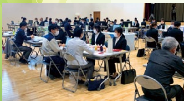
ホール(第1会場)の様子

83名の学生が各ブースの採用担当者から説明を受け、学生は終了時間までブースを回り、事業内容や求人条件の詳細、応募方法など熱心に情報収集をしていました。