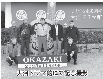
大河ドラマ館にて記念撮影