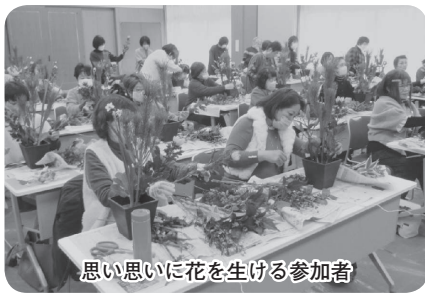
思い思いに花を生ける参加者

今後も女性会では、女性経営者の経営の役に立ち、会員相互の交流が図られるような事業を計画していきます。