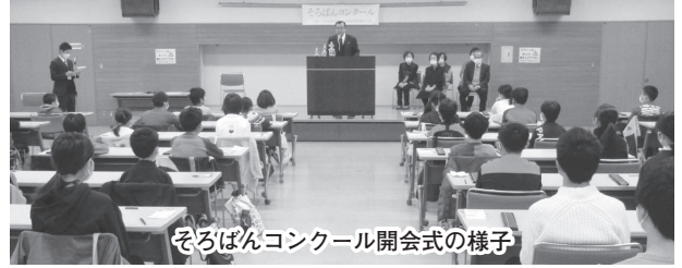
そろばんコンクール開会式の様子

日本珠算連盟飯田支部は、12月3日(日)に飯田市勤労者福祉センターにおいて「第47回そろばんコンクール」を開催し、未就学児から中学校2年生までの合計62名が日頃の練習の成果を競いました。