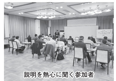
説明を熱心に聞く参加者

終了後には懇親会も行い、久しぶりに各支部会員同士の交流が図られ、有意義な時間となりました。