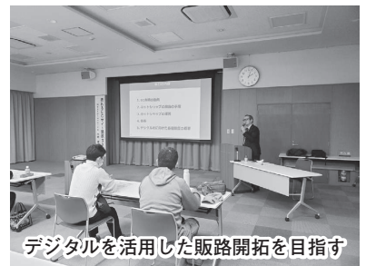
デジタルを活用した販路開拓を目指す

説明後には講師に熱心に質問をする参加者も見られ、デジタル化の促進に向けて有意義なセミナーとなりました。