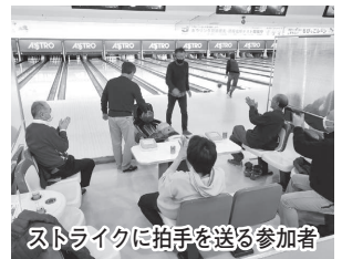
ストライクに拍手を送る参加者